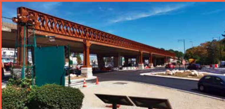
RD 906 Clamart-habillage métallique du pont de l'A86

Plus d'informations dans la rubrique cadre de vie sur www.hauts-de-seine.fr